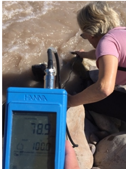
Fig.2 Muestro y toma de datos en Rio Arenales.

En cada sitio de muestreo se determinaron in situ la temperatura y la concentración de oxígeno disuelto (OD) en agua superficial (Fig. 2) las que fueron medidas utilizando sensores HI9146 debidamente calibrados. Los valores de 5-8 mg/l se consideran Aceptables y los de 8-12 mg/l Buenos, adecuados para la vida de la gran mayoría de especies de peces y otros organismos acuáticos.