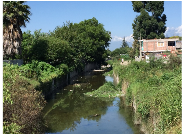
Fig.3. (izq.) Río Arenales y Calle Japón – calidad muy buena, (der.) Arroyo Velarde y Pte Julio Paz – calidad mala.

La mayoría de la cubierta vegetal es autóctona ( Salix humboldtiana , Prosopis alba , P. nigra , Anadenanthera colubrina , Manihot grahamii , Celtis ehrenbergiana , Schinus areira , Tecoma stans ), en algunos sitios acompañan especies exóticas como Mora sps., Eucaliptus sp. Ricinus communis , Melia azedarach ,