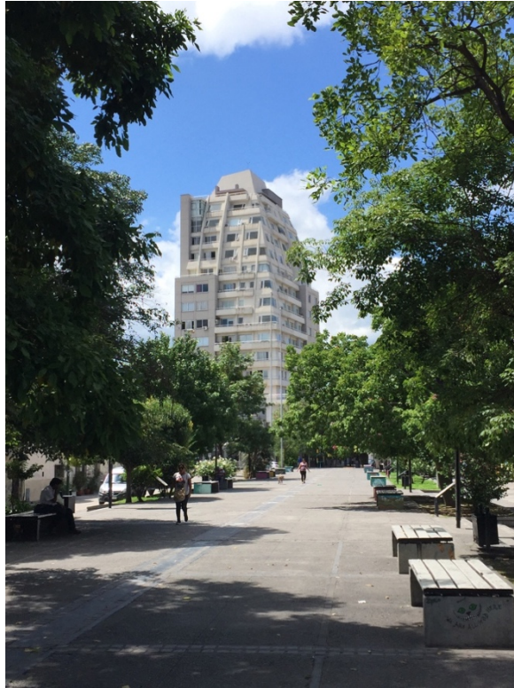
Fig.7. Arroyo Esteco Soterrado.

A fin de mejorar los índices de Calidad de bosque de ribera sería necesario garantizar la cubierta vegetal existente y llevar a cabo proyectos de restauración que mejorara el canopeo arbóreo o cobertura con especies nativas. Para incrementar los beneficios que aportarían los canales urbanos se debería trabajar en especial en incrementar los beneficios ecológicos, sociales y económicos. Para los primeros, sería imprescindible disminuir el porcentaje de superficies impermeables lo cual permitiría el arraigado de vegetación, especialmente palustre. Esto, sumado a mantener un espejo de agua, aumentaría la oferta de hábitat de fauna. Una mixtura de usos en los predios frentistas mejoraría en el eje económico y aportaría al social, con mayor presencia de gente en la calle. Para esto, sería adecuado mejorar o incorporar mobiliario urbano que permitiera a la gente sentarse y practicar actividades físicas activas.