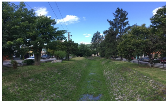
Fig. 4. Arroyo sobre av. Constitución.

El valor más alto corresponde al tramo del Ao. Esteco soterrado porque se trata de un paseo urbano con muy buena provisión de árboles de gran porte que brindan sombra. Llega a alcanzar un valor de bueno. Al estar soterrado sus beneficios ecológicos son bajos, pero se ubica en un área con mixtura de usos de suelo con beneficios económicos y estéticos que aumentan el valor del índice. El Ao. en Avenida Constitución también aporta calidad con diferentes beneficios especialmente por sus valores ecológicos y escénicos. (Fig. 4).